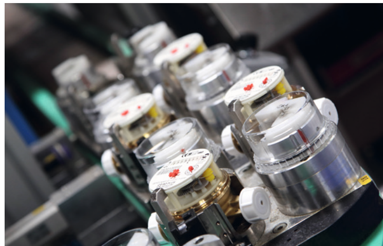
Drei Millionen Geräte produziert Maddalena jedes Jahr

manager, der bereits die 4. Generation im Unternehmen vertritt. Immer mehr Produkte kamen hinzu. Seit den 1990er-Jahren, als die Produktion gesteigert werden sollte und das Exportgeschäft anvisiert