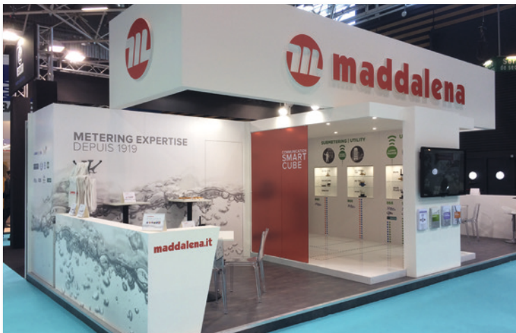
Mit 120 Mitarbeitern und einem Umsatz von 40 Millionen EUR ist Maddalena Marktführer in Italien

Ganz moderne Zähler können auch den Wasserdruck und Verluste messen. „Wir sind die Ersten, die diese neue Generation herausbringen“, betont der Manager, der festgestellt hat, dass das Bewusstsein der Menschen für den Wasserverbrauch gestiegen ist. Die Lage in Italien sei dennoch nicht gut. „Dort geht, bedingt durch die alten Anlagen