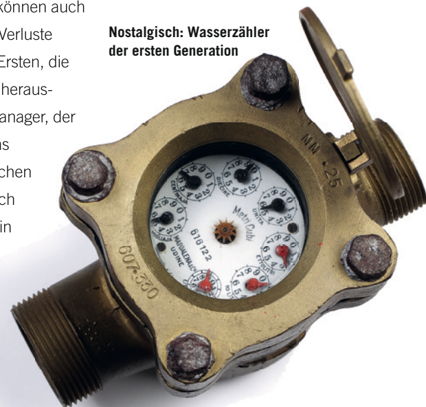
Nostalgisch: Wasserzähler der ersten Generation