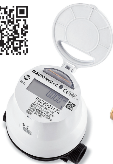
Electo MVM + C