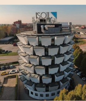
Isoil Industria. Sede operativa

Presente sul mercato nazionale e internazionale da 60 anni, Isoil Industria realizza "Le soluzioni che contano" in molti settori industriali attraverso prodotti e servizi innovativi e con la divisione Isocontrol si occupa del ciclo integrato delle acque.