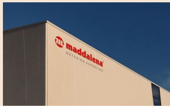
Maddalena. Sede stabilimento

biennale. Maddalena è inoltre la prima azienda italiana del settore che dispone di un laboratorio di taratura per contatori d'acqua accreditato secondo la norma UNI CEI EN ISO/IEC 17025:2005 e può contare su un settore R&D premiato per le soluzioni nel campo della connettività e dello smart metering, la trasmissione radio a distanza dei dati di consumo. Affidabilità, flessibilità, attenzione per la qualità, disponibilità a soddisfare rapidamente ogni richiesta dei clienti sono i punti di forza che fanno di Maddalena l'azienda di rife-