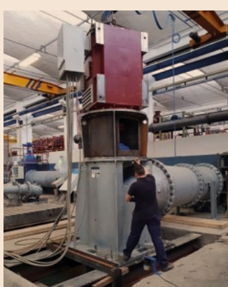
Gruppo Aturia, pompa PAG 1000S durante la fase di collaudo

GRUPPO ATURIA è storicamente presente da oltre 100 anni nel settore delle pompe centrifughe grazie all'integrazione di cinque famosi costruttori italiani per applicazioni in diversi settori.